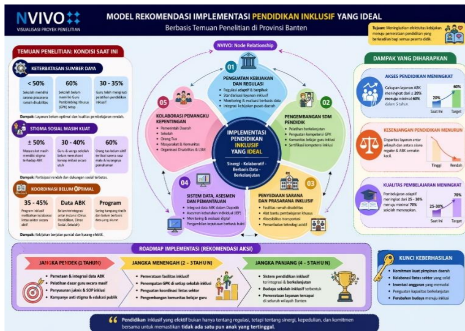
Gambar.3 Model Implementasi Pendidikan Inklusif

Menyusun rekomendasi berbasis temuan penelitian untuk meningkatkan efektivitas kebijakan di masa depan.