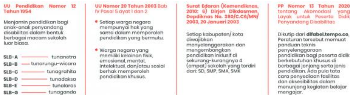
Gambar 2. Payung Hukum Pendidikan Inklusif